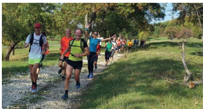
Am Erntedankfest trifft man sich beim Apfellauf und Apfelwalking.