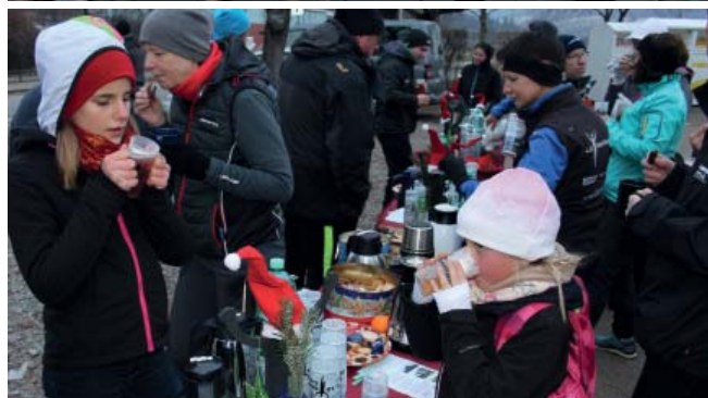
Beliebt bei Jung und Alt: Der traditionelle Bredles-Lauftreff und -Walkingtreff.