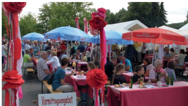
Der (für uns) schönste Stand auf dem Rosenmarkt.