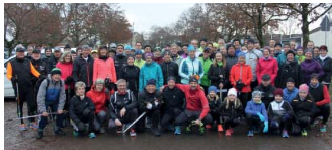
Silvester - die letzte Gelegenheit des Jahres zum gemeinsamen Laufen und Walken mit der LGSZ