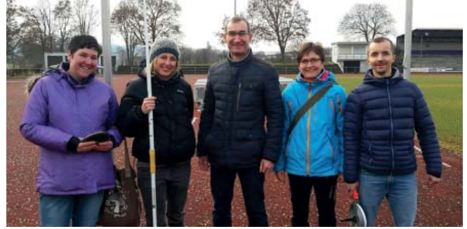
Neue LG Steinlach-Zollern-Kampfrichter nach erfolgreicher Ausbildung im Februar 2019

UM DIE TERMINVIELFALT UND DIE BELASTUNG WEITERHIN MÖGLICHST AUF ZAHLREICHEN SCHULTERN VERTEILEN ZU KÖNNEN, WERDEN WEITERE INTERESSIERTE GESUCHT, DIE SICH EINE SCHULUNG UND EINEN EINSATZ ALS KAMPFRICHTER VORSTELLEN KÖNNEN.